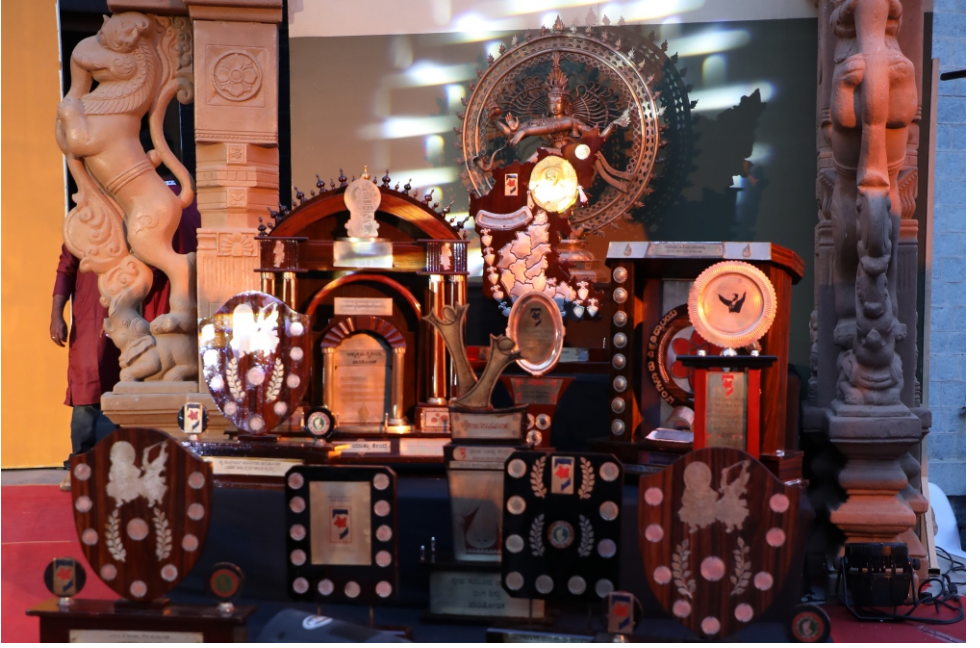
ಸಿಂಹಾನಲ್ಲೂರು ಪುಟ್ಟಸ್ವಾಮಯ್ಯ ಅತ್ಯುತ್ತಮ ನಾಟಕ ಪಾರಿತೋಷಕ